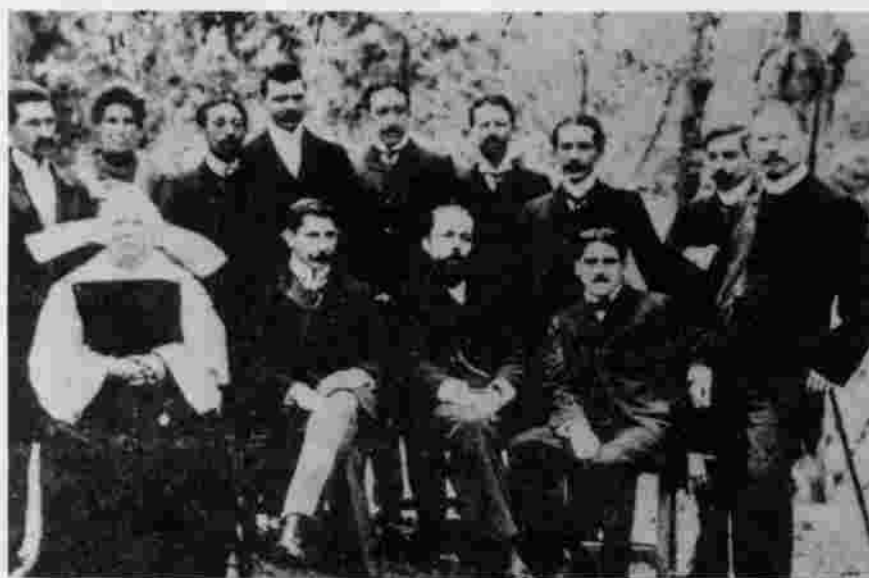
Fundadores de la Sociedad de Cirugía de Bogotá

La Academia absuelve una consulta del Ministro Sr. Marco Fidel Suárez limitando la atención de los enfermos pobres de solemnidad en el Hospital de San Juan de Dios