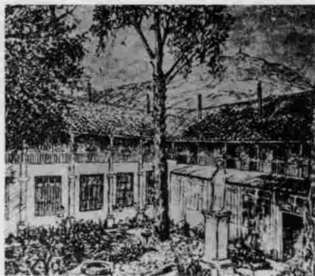
Viejo Claustro Santa Inés.