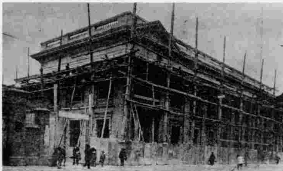
Facultad de Medicina en construcción.