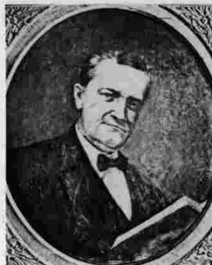
Doctor Luis Zea Uribe

óleo sobre lienzo. 67 x 52 cms. 1939 Propiedad Academia Nacional de Medicina