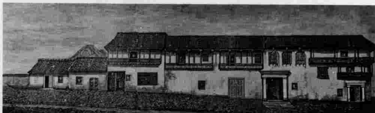
Santa Fé de Bogotá. Antigua Casa Acera Sur de la Plaza de Bolívar.

Revista Médica (Bogotá). Revista de Higiene (Bogotá) "Revista Dental" (Bogotá) "Boletín de Medicina del Cauca" (Popayán)