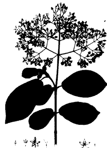
Chinchona Dissimiliflora Leon. XXX.A

Instituto Colombiano de Cultura Hispánica