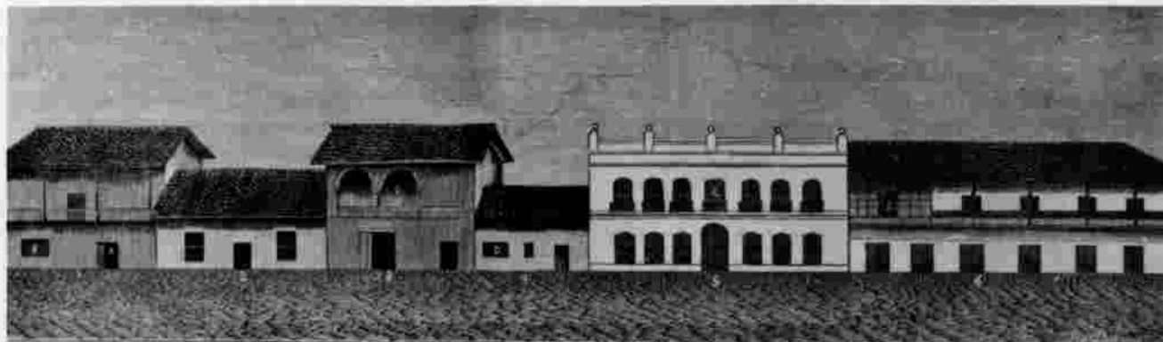
Antigua Acera Occidental de la Plaza de Bolívar.