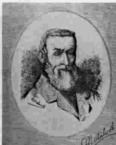
Manuel Uribe Angel Tomado de Papel Periódico Ilustrado Dibujo Alberto Urdaneta. Gravado Alfredo Greñas. s.f.