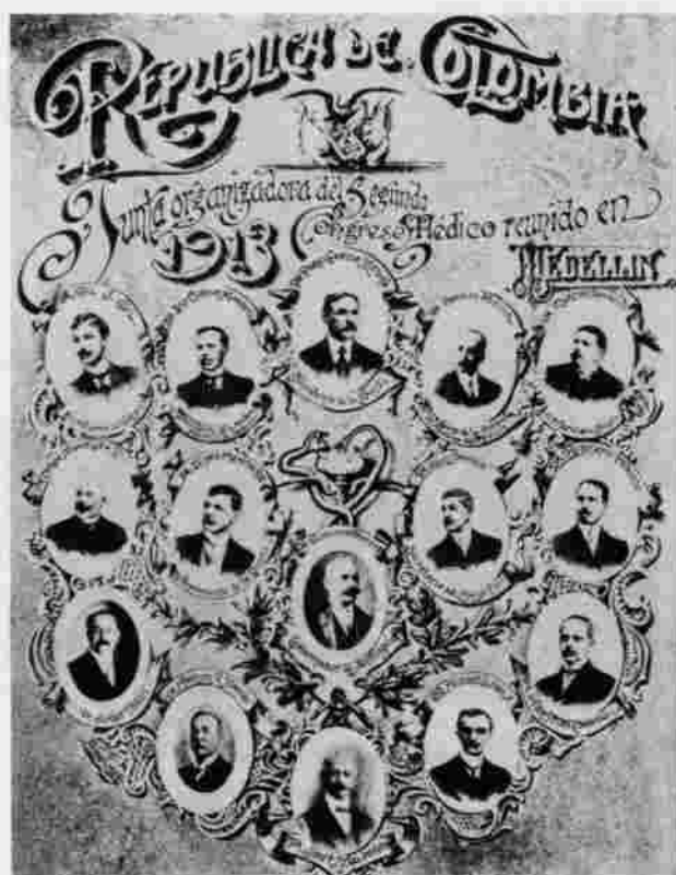
Junta organizadora del Segundo Congreso Médico