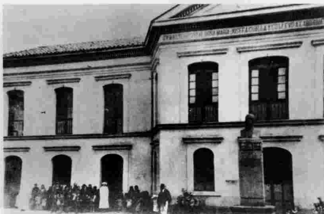
Facultad de Medicina