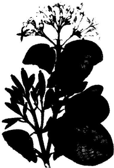
Chinchona Ovalifolia Leon.