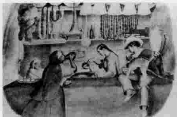
Tienda de vender Chicha en Bogotá.