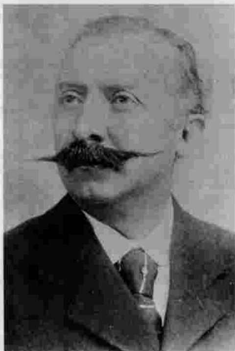
Presidente Rafael Reyes

Tomado de Rafael Reyes Memorias 1850-1885 Fondo cultural Cafetero