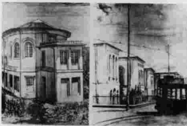
Hospital San José

Durante el bienio se realizan apenas ocho sesiones, entre otras por la falta de una sede estable. En 1927 es nombrado