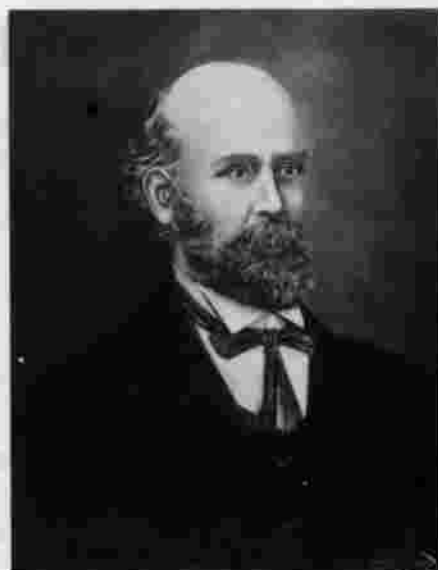
Doctor Liborio Zerda